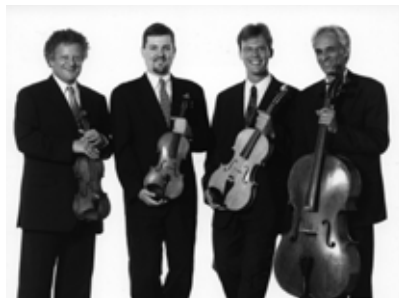
The Arditti Quartet